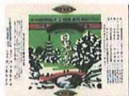
創業当時の屋号「日光の館」