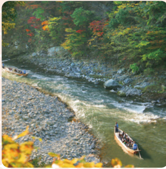
鬼怒川・川治：鬼怒川ライン下り