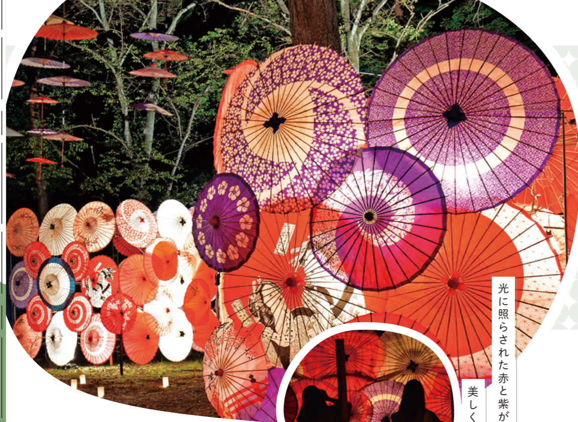
光に照らされた赤と紫が 美しく映える♡

秋ならではのイベントや アクティビティが盛りだくさん♪ 見て・遊んで・楽しもう!!