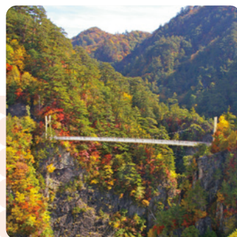
湯西川・川俣・奥鬼怒：瀬戸合峡