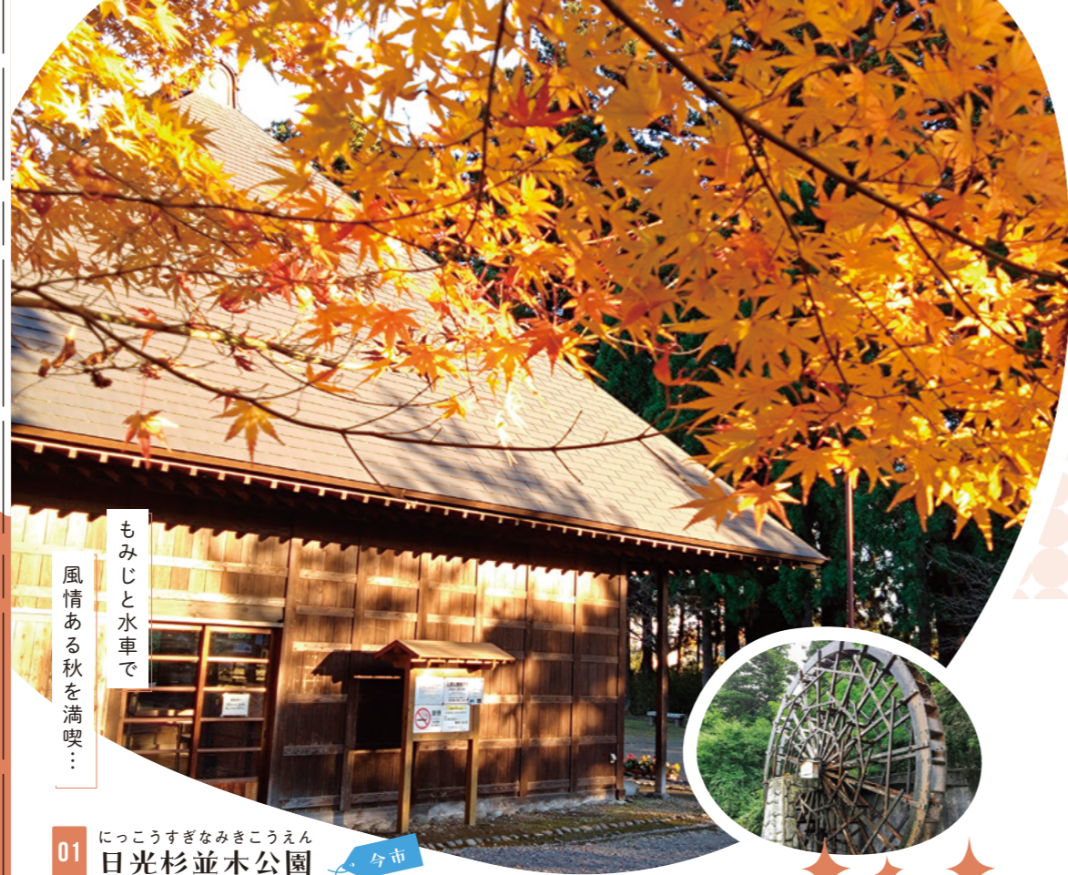
もみじと水車で 風情ある秋を満喫！