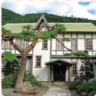
足尾：古河掛水倶楽部