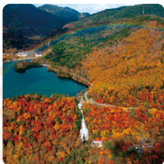
日光：日光国立公園