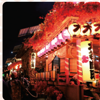
今市：今市屋台まつり