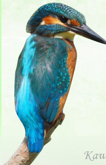
Kawaji Onsen 川治温泉

コバルトブルーの色鮮やかな外見から、「溪流の宝石」と呼ばれています。清流の多い市内に生息しています。