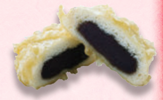
มันจูห่อฟองเต้าหู้ทอด

ผักดองซึ่งเกิดขึ้นมาตั้งแต่สมัยเอโดะเป็นหนึ่งในอาหารพิเศษที่เป็นตัวแทนของนิกโก ในเมืองมีร้านผักดองเก่าแก่มากมาย แต่ละร้านมีความมุ่งมั่นที่แตกต่างกันในเรื่องของรสชาติและวิธีการผลิตที่สืบทอดกันมา ลองชิมและค้นหาอาหารจานโปรดของคุณ นอกจากนี้ยังมีร้านผักดองที่ให้บริการอาหารเช้าแบบญี่ปุ่นดั้งเดิม